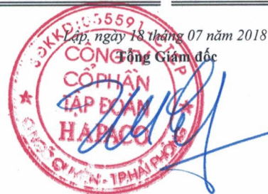
Vũ Xuân Cường