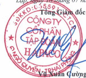
Vũ Xuân Cường